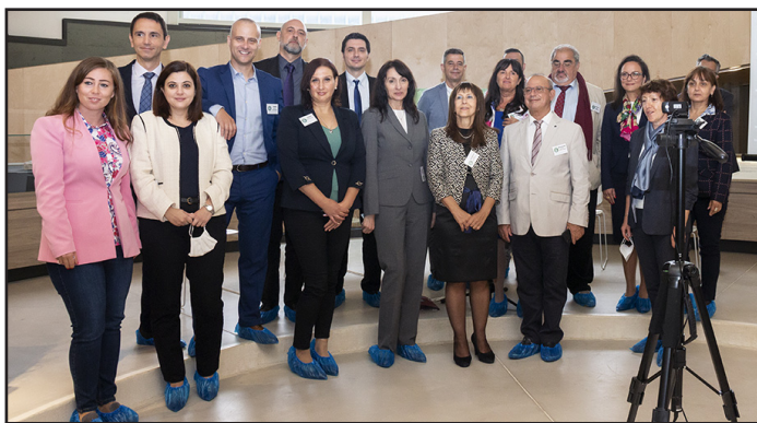
Участниците в конференцията, които бяха в Епископската базилика в Пловдив

Според участниците в конференцията под въздействието