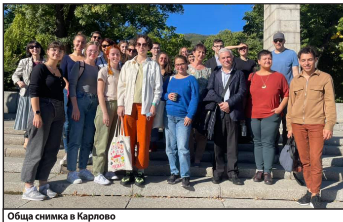
Обща снимка в Карлово

Наситената програма на конференцията беше умело съчетана и с културни мероприятия. Освен вече споменатата разходка из карловските улички по време на престоя ни в Пловдив имаме възможността да посетим новооткритата Епископска базилика от IV век и да