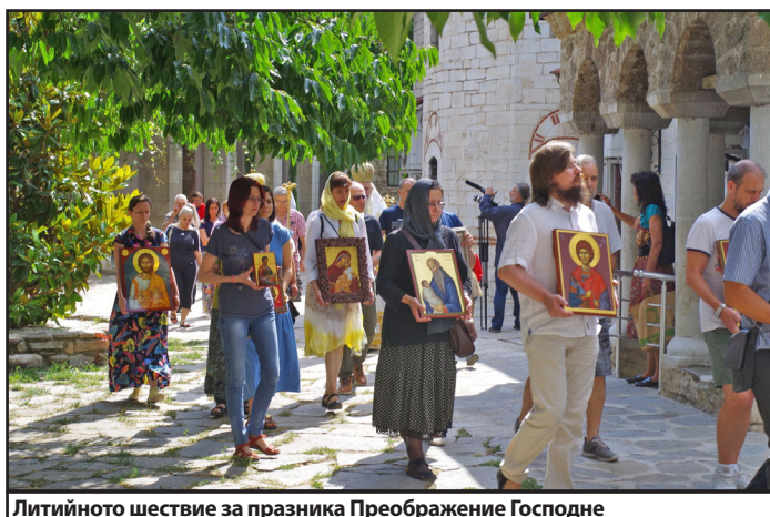
Литийното шествие за празника Преображение Господне

Българското иконографско сдружение (БИС) съществува от 2006 година, а през 2011 г. е учредено и като неправителствена организация със свой устав и управителен съвет. В него в настоящия момент членуват повече от 40 иконографи, резбари и техни съмишленици. От 2020 година, когато беше чествана 150-годишнината от възстановяването на самостоятелната българска църква, по покана на Негово Преосвещенство Величкия епископ Сионий, игумен на Бачковската света