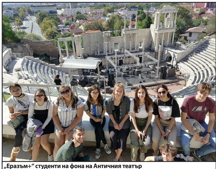
„Еразъм+“ студенти на фона на Античния театър

За чуждестранните студенти бе организирана традиционната разходка, представяща културно-историческото наследство на древния град. Новите „Еразъм+“ студенти посетиха Античния театър и Етнографския музей. Запознаха се отблизо с българския бит