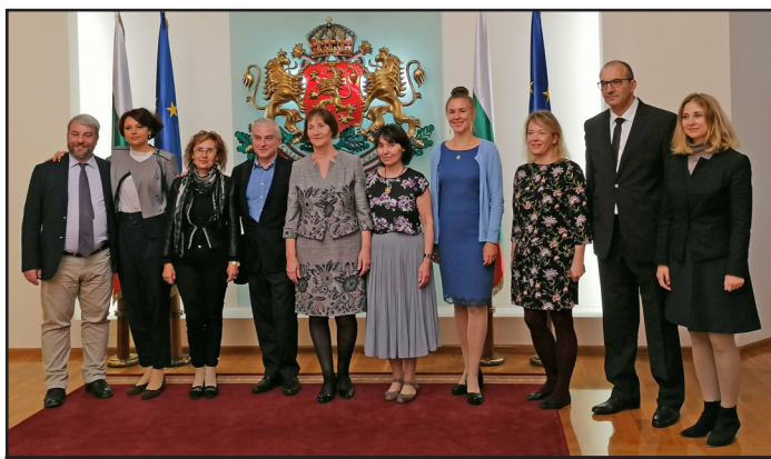
Ръководителите на екипите в Гербовата зала на Президентството

Няма да преувеличим, ако отбележим, че конференцията